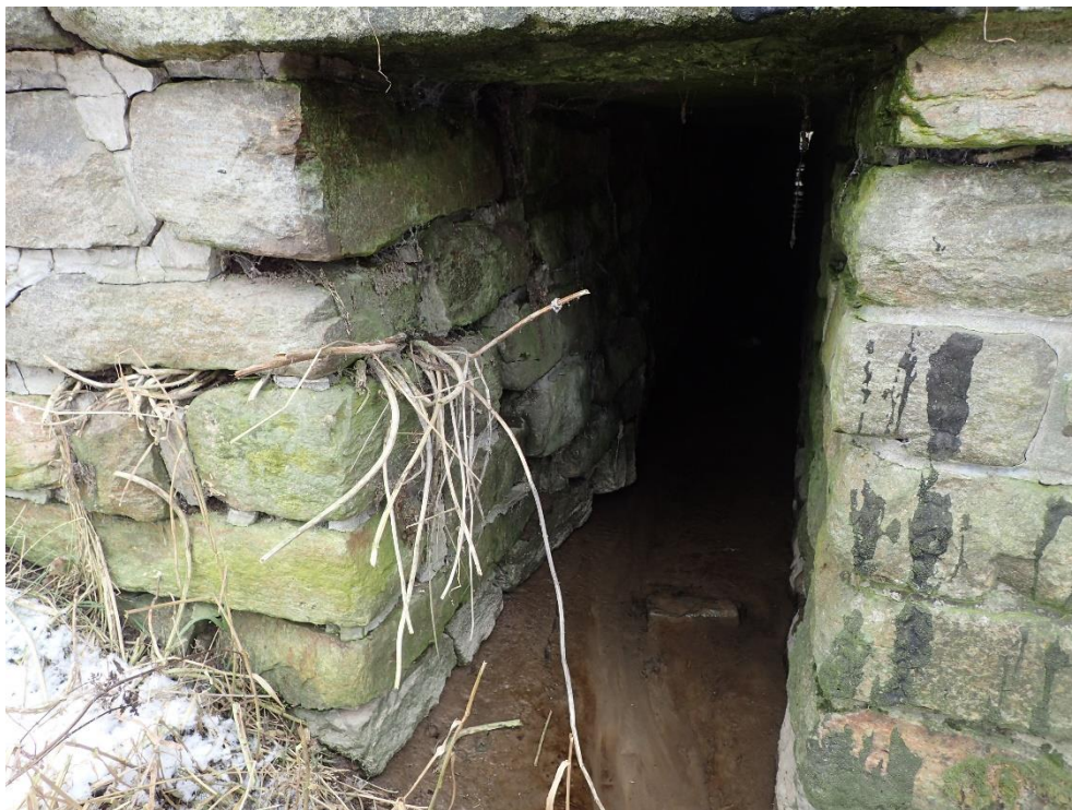
Foto 3: Popraskané a místy yydrolené spárování mezi kameny, prorůstání vegetace